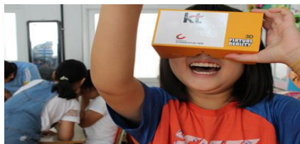
카드보드지를 활용한 VR체험