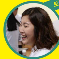
복지현장 정기분 (부산편드레이저)